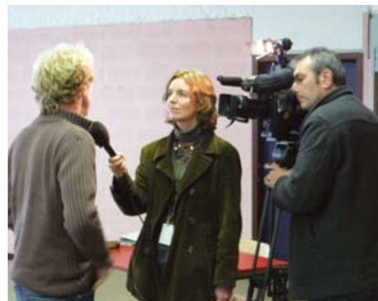
Interview pour la télé locale namuroise Canal C

« VolonTerre ». Ils relaient les campagnes et prises de positions ainsi que les projets soutenus. VIVRE ENSEMBLE est aussi sur la « toile »: www.vivre-ensemble.be