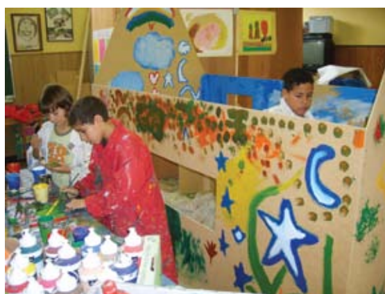
Asbl Éclat de rire dans la région liégeoise

Cet appui est rendu possible par les collectes réalisées dans les paroisses lors de la campagne de l'Avent, en décembre, et grâce à de nombreux dons de particuliers.