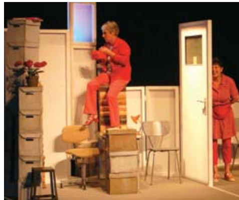
De l'humour pour un sujet grave

élaborées par des personnes qui vivent l'exclusion et qui racontent leur quotidien avec humour et la volonté d'entrer en relation avec le public. Chaque représentation a été suivie d'un débat.