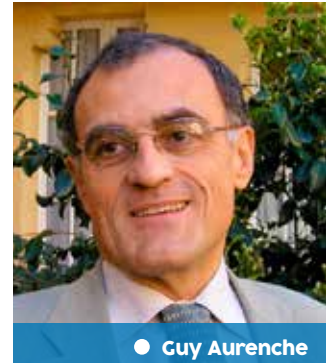
● Guy Aurenche