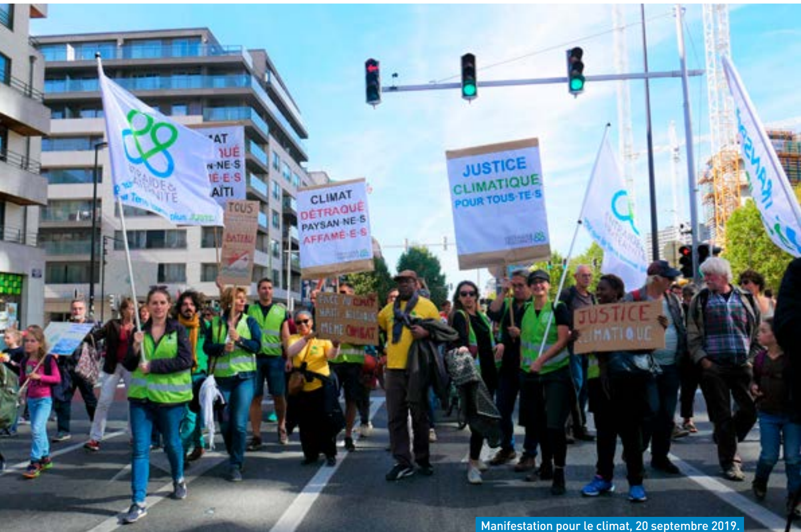
Manifestation pour le climat, 20 septembre 2019.

« La planète bleue a besoin de jaune pour redevenir verte. » Inscription lue sur un gilet jaune