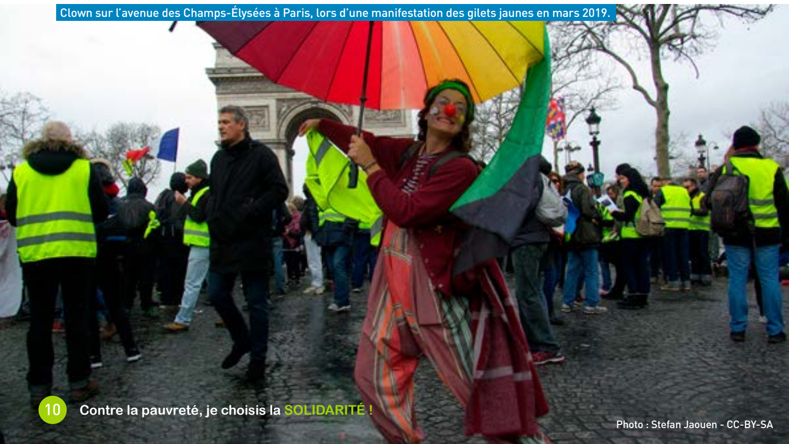
Clown sur l'avenue des Champs-Élysées à Paris, lors d'une manifestation des gilets jaunes en mars 2019.

Dans les mesures à prendre, il y a des convergences possibles entre protection de l'environnement et justice sociale. En matière de logement , par exemple. Avoir accès à un logement salubre, isolé, dépourvu de ces vieux chauffages électriques qui surconsomment, muni de châssis qui évitent de chauffer autant l'extérieur que l'intérieur... Voilà qui améliorerait la qualité de vie des moins nantis et bénéficierait à l'environnement. En matière de