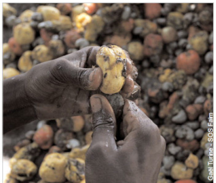
Gaël Turine - SOS Faim

- Rééquilibrer les rapports de force entre acteurs des chaînes agroalimentaires, en renforçant le pouvoir de marché des producteurs par rapport à l'industrie agroalimentaire et la grande distribution, afin de garantir que des conditions d'approvisionnement respectueuses des besoins, attentes et intérêts légitimes de tous les acteurs.