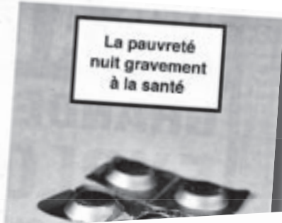
VERS L'AVENIR 12 décembre 2008

Ce week-end, « Action Vivre Ensemble », une association mandatée par les évêques de Belgique, mène une action de collecte de fonds. Samedi et dimanche, elle fait une grande collecte de dons dans les paroisses de la communauté française. En Brabant wallon, elle espère obtenir environ 25 000 €, servir à soutenir des actions de la grande Action vivre ensemble. Cette année, l'objectif est de récolter 500 000 € pour sa région. Car « Nos jeunes doivent à Catherine-Bénédicte de l'association Vivre ensemble » les avoirs mais l'achat d'un logement est une priorité.