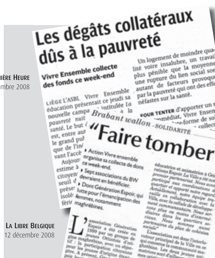
LA LIBRE BELGIQUE 12 décembre 2008