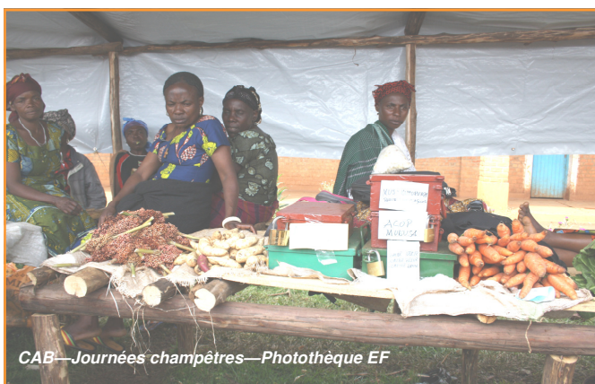
CAB—Journées champêtres

Le programme d'appui à l'agriculture paysanne en cours a été lancé en 2009 et a évolué entre les élections de 2006 et celles de 2011. Il était attendu qu'il se réalise dans un cadre politique et socio-économique plutôt positif, marqué par d'importants investissements dans le cadre du Programme des 5 Chantiers du Président Kabila et de la politique de reconstruction annoncée par le Gouvernement au niveau local et national.