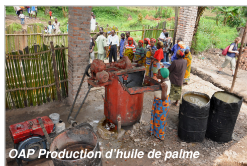
OAP Production d'huile de palme