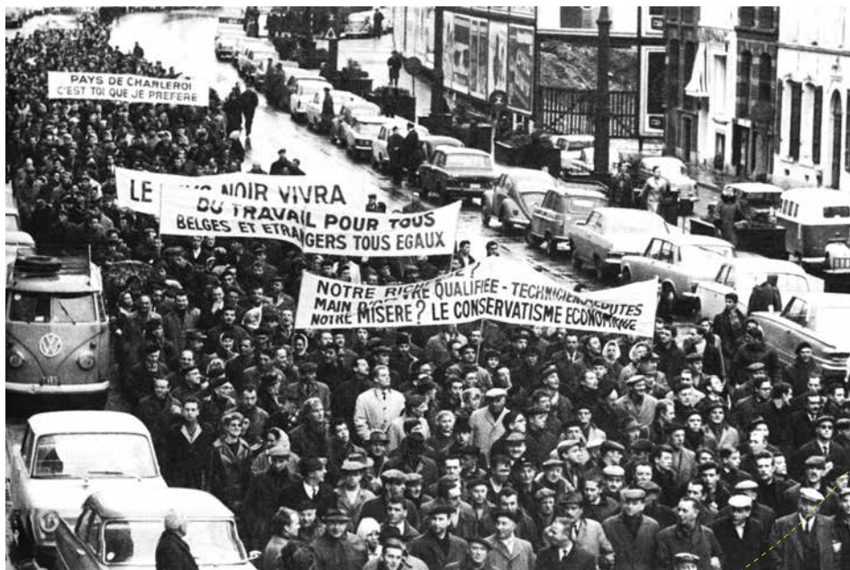
© CARRHOP, La Cité, Grève à Charleroi, années 1970

Les premiers slogans des campagnes de l'Avent parlent surtout des plus démunis et démunies. Mais rapidement, Action Vivre Ensemble interpelle les mécanismes structurels qui génèrent la pauvreté et l'exclusion sociale.