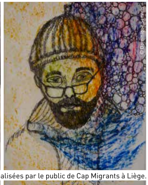
Des oeuvres réalisées par le public de Cap Migrants à Liège.