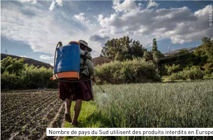
Nombre de pays du Sud utilisent des produits interdits en Europe.