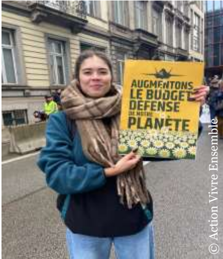
Jeune militante lors de la Marche pour le Climat à Bruxelles (5/10/2025) – « Augmentons le budget défense de notre planète »

Le co-président du parti Ecolo, Samuel Cogolati dénonce quant à lui une ventilation des dépenses militaires « complètement anarchique »... « La vraie question en matière de défense, et que personne n'ose affronter dans la classe politique, c'est que nous dépensons horriblement mal » 4 . En effet, le co-président d'Ecolo, s'il n'est pas contre un réarmement de l'Europe, plaide pour une stratégie commune des efforts de guerre entre les différents pays européens et rappelle l'urgence climatique qui nous concerne toutes et tous : « Moi, je plaide pour les Etats-Unis d'Europe autonome sur le plan militaire mais aussi sur le plan énergétique. Et ça, c'est le grand oublié. La guerre climatique aujourd'hui est complètement oubliée et pourtant c'est un ennemi avec lequel vous ne pourrez pas négocier » 5 .