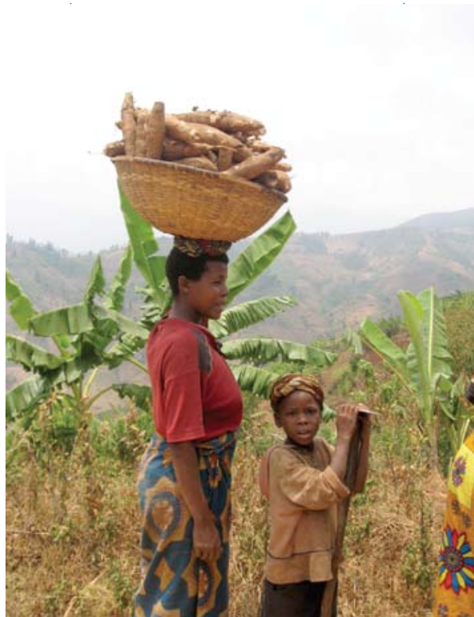
90% de la population active dans le secteur agricole.