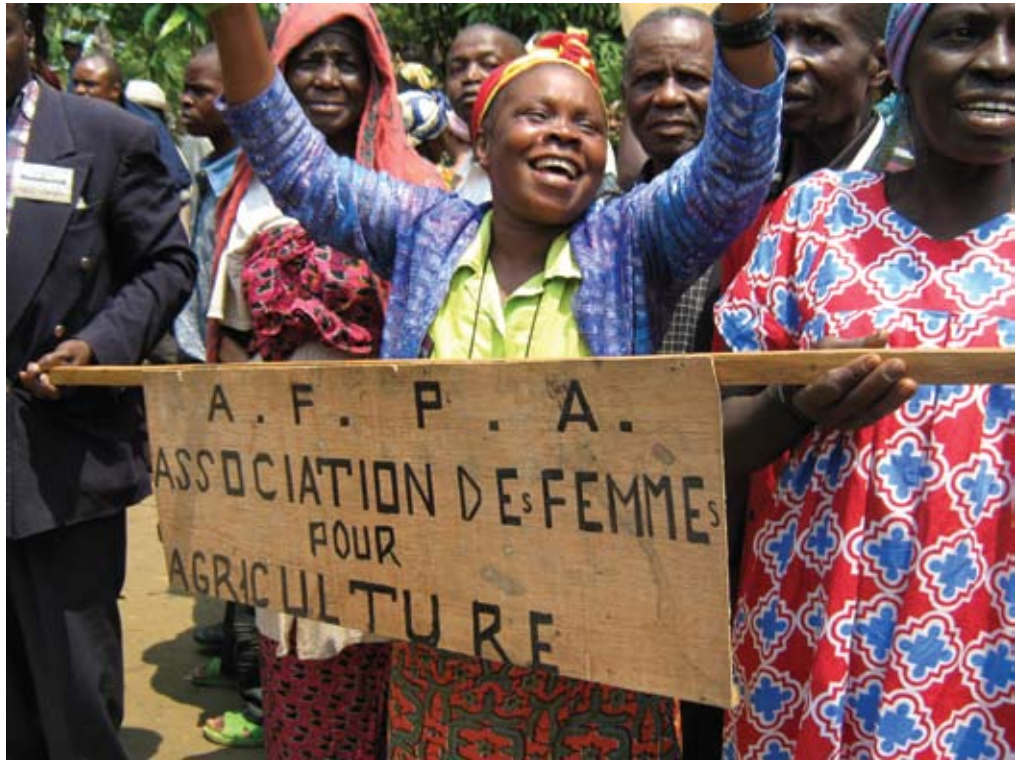
Les récoltes ne suffisent pas à nourrir la famille