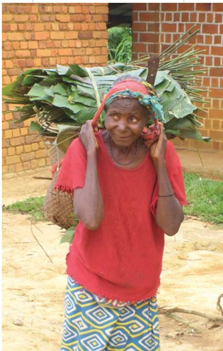
photo : Pierre Gillet : Des activités qui améliorent l'alimentation de tous

Le Comité Anti-Bwaki accompagne 22 Comités de développement et 16 Groupements féminins dans 318 villages autour de Bukavu (Sud-Kivu), ainsi que dans les bidonvilles de Bukavu. Dans ce rayon d'action, le programme de développement rural permet de toucher 400 000 habitants.