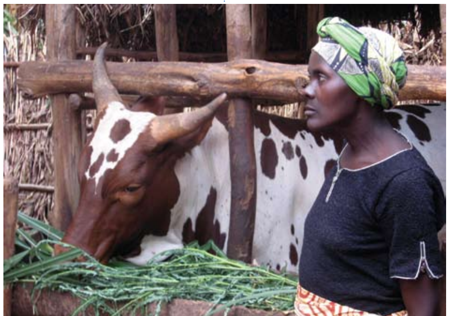
Des petits groupes de base se forment pour cultiver ensemble des parcelles modestes