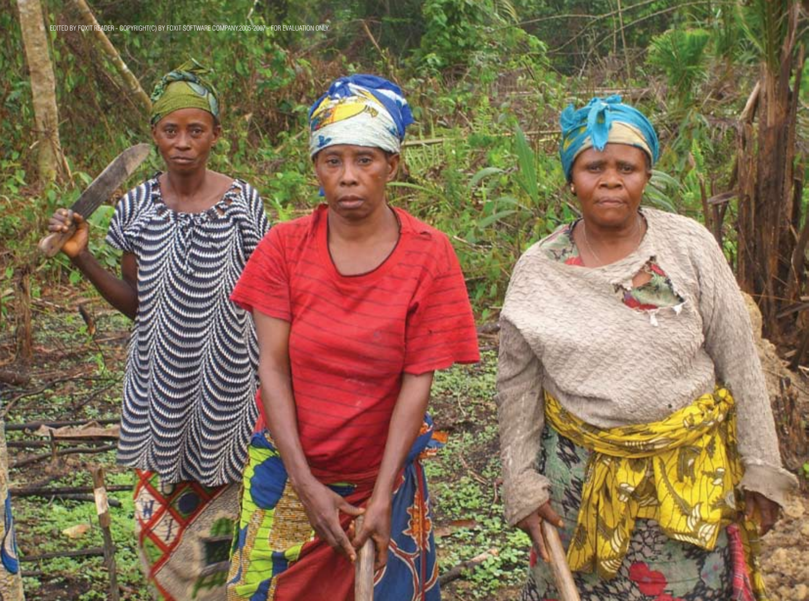
Photo : Hélène Errebault : Les femmes produisent 90% de la nourriture

Ces associations locales déploient différentes initiatives qui aident les paysans à vivre de leurs récoltes : distribution de semences et d'outils, formation des paysans à l'agriculture biologique et à de nouvelles méthodes pour semer et récolter, octroi de petits crédits et constitution de petites mutuelles de solidarité.