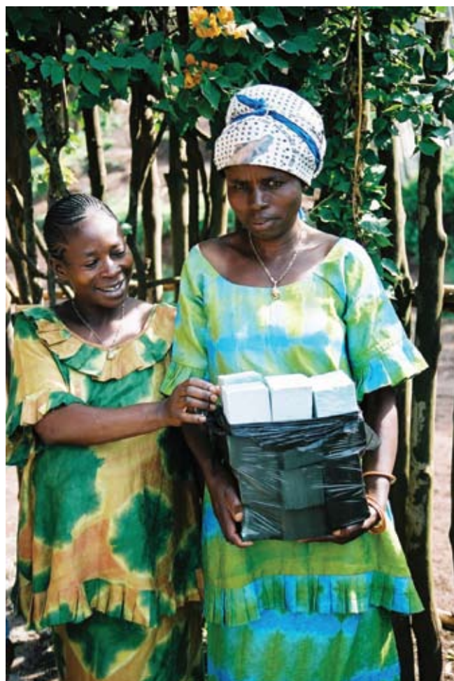
L'espoir d'une vie décente grâce à l'appui du microcrédit.

Des rencontres mixtes annuelles sont organisées entre des hommes et des femmes qui n'ont pas de lien marital.