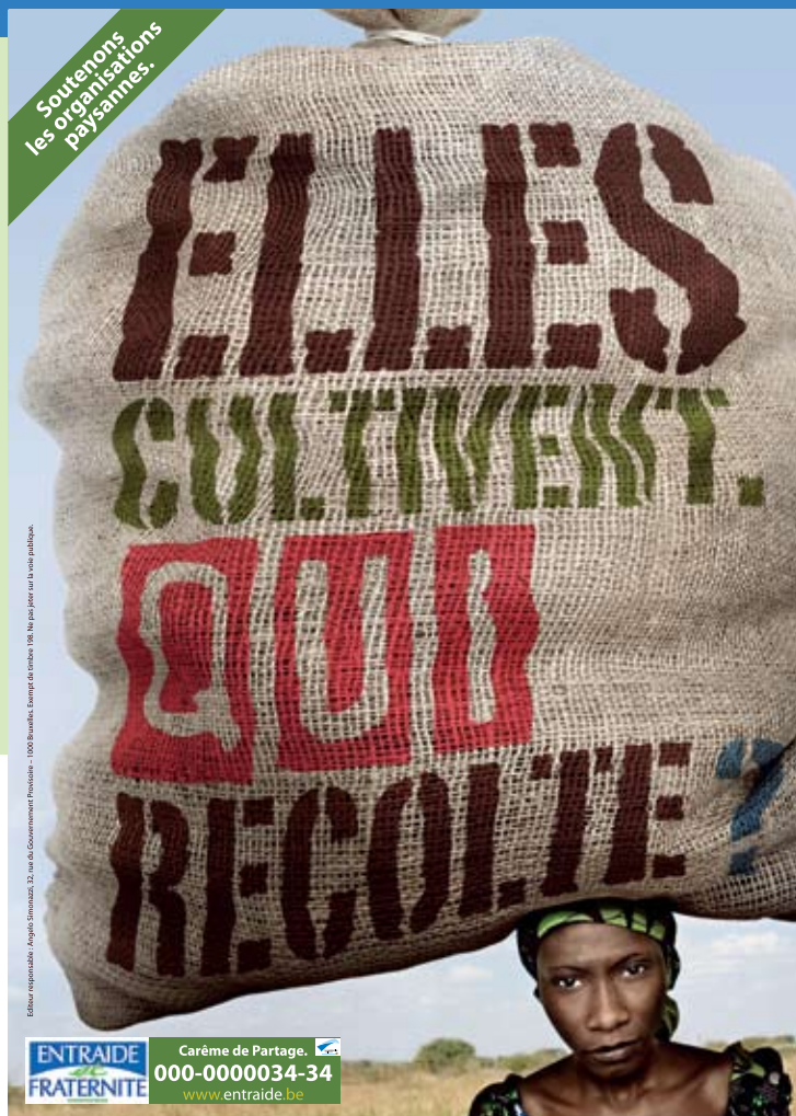
Editeur responsable: Régis Stinsson, 32 rue du Gouvernement Provisoire - 1000 Bruxelles. Extrait de numéro 198. Ne pas jeter sur la voie publique.

Visitez notre site Internet: www.entraide.be