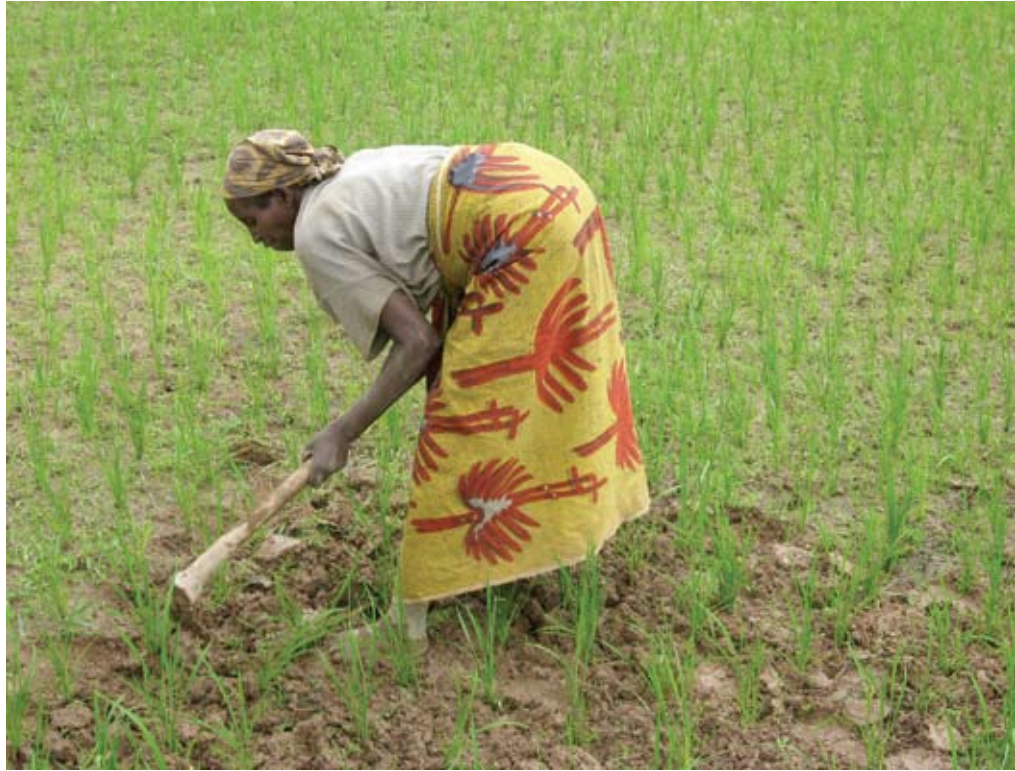
Les femmes, des actrices clés de l'agriculture

Les revenus des ménages sont trop faibles pour se nourrir et satisfaire les besoins de base (santé, éducation des enfants, etc.).