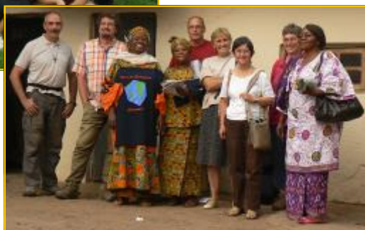
Voyage-relais, groupe de volontaire de la région de Namur/ Luxembourg / Hainaut au Congo/Rwanda, été 2009