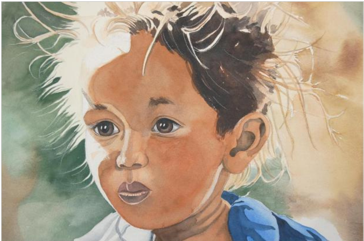
Aquarelle d'Aline Gason d'après photo d'une enfant de la vallée du Dolpo (Népal)

Poser un regard profond sur le monde, Se laisser toucher par sa lumière, Pour pouvoir marcher en confiance, A la rencontre de notre humanité.