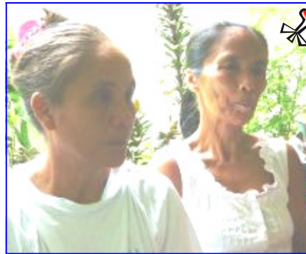
Deux agricultrices de Malbogon, dont l'une nous a affirmé avec un grand sourire qu'elle aimait son travail, même quand c'était difficile à cause du climat.