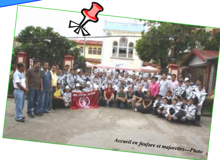
Accueil en fanfare et majorettes—Photo

Le soir, les autorités municipales nous avaient préparé une grande fête d'accueil (majorettes, chants, musique par des enfants...). J'étais très émue. Quel accueil !