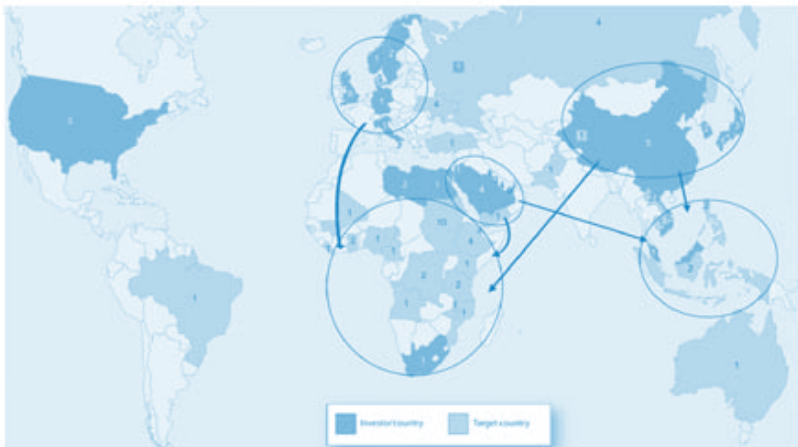
Investor and target regions and countries in overseas land investment for agricultural production, 2006–May 2009 (Number of signed or implemented deals)

Parmi les pays « riches en ressources, mais pauvres financièrement », on trouve les pays aux vastes étendues de terre en principe « disponibles ».