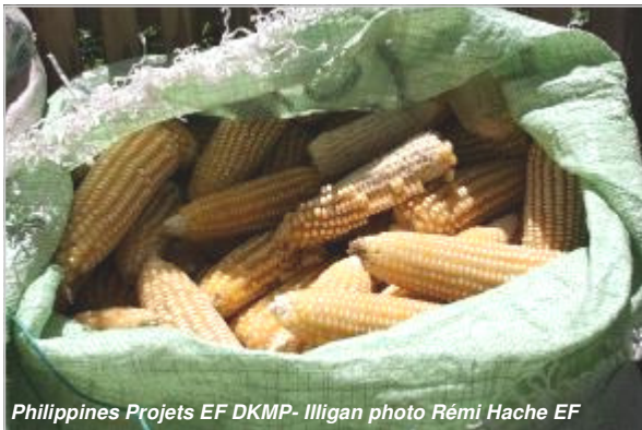
Philippines Projets EF DKMP- Illigan

(...) Voir document PDF de l'atelier 3 « Les impacts des politiques Nord sur le Sud en matière d'accès à la terre et à son contrôle : PAC, Agro-carburants » sur www.entraide.be