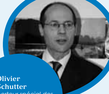
Par Olivier De Schutter Rapporteur spécial des Nations Unies sur le droit à l'alimentation

C'est un paradoxe de la situation actuelle que les arguments en faveur de l'extension des échanges commerciaux des produits agricoles n'ont jamais été aussi puissants, alors qu'en même temps l'affirmation de la souveraineté alimentaire, en tant que paradigme alternatif à la sécurité alimentaire par le commerce international, prend un tour particulièrement urgent. Comment l'expliquer? Si la polarisation est plus forte que jamais, ce n'est pas que les observateurs diffèrent sur le diagnostic: ils s'affrontent en revanche sur les remèdes.