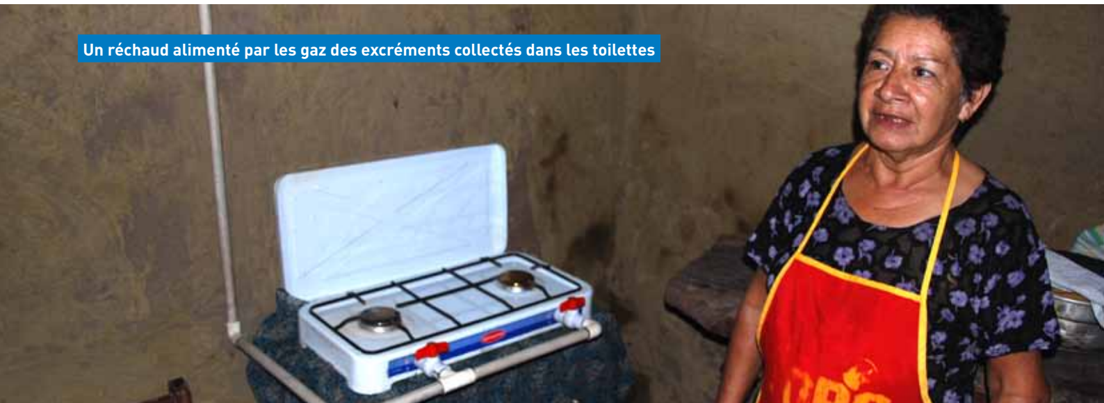
Un réchaud alimenté par les gaz des excréments collectés dans les toilettes