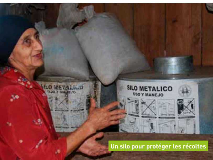
Un silo pour protéger les récoltes

Il s'agit de tout mettre en œuvre pour nourrir la population. Ou plutôt, pour que la population parvienne à mieux se nourrir elle-même. Des groupes de paysans bénéficient de formations et d'appuis financiers sous forme de microcrédits.