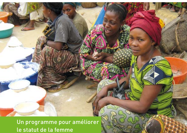
Un programme pour améliorer le statut de la femme

Réserve démesurée de ressources naturelles (terres et eau), la République Démocratique du Congo (RDC) est la cible de choix pour les acquéreurs, exploitants et investisseurs privés ou publics. Concessions forestières et minières à la limite de la légalité, lacunes d'un système foncier dual profitant aux propriétaires terriens, ouverture politique à une libéralisation accrue des politiques agricoles, tel est le contexte qui accueille, aujourd'hui, les accords de location massive de terres, signés ou en discussion. Et ce sont les conditions de vie de la population majoritaire du pays - des paysans et des paysannes - qui se détériorent toujours davantage. 1