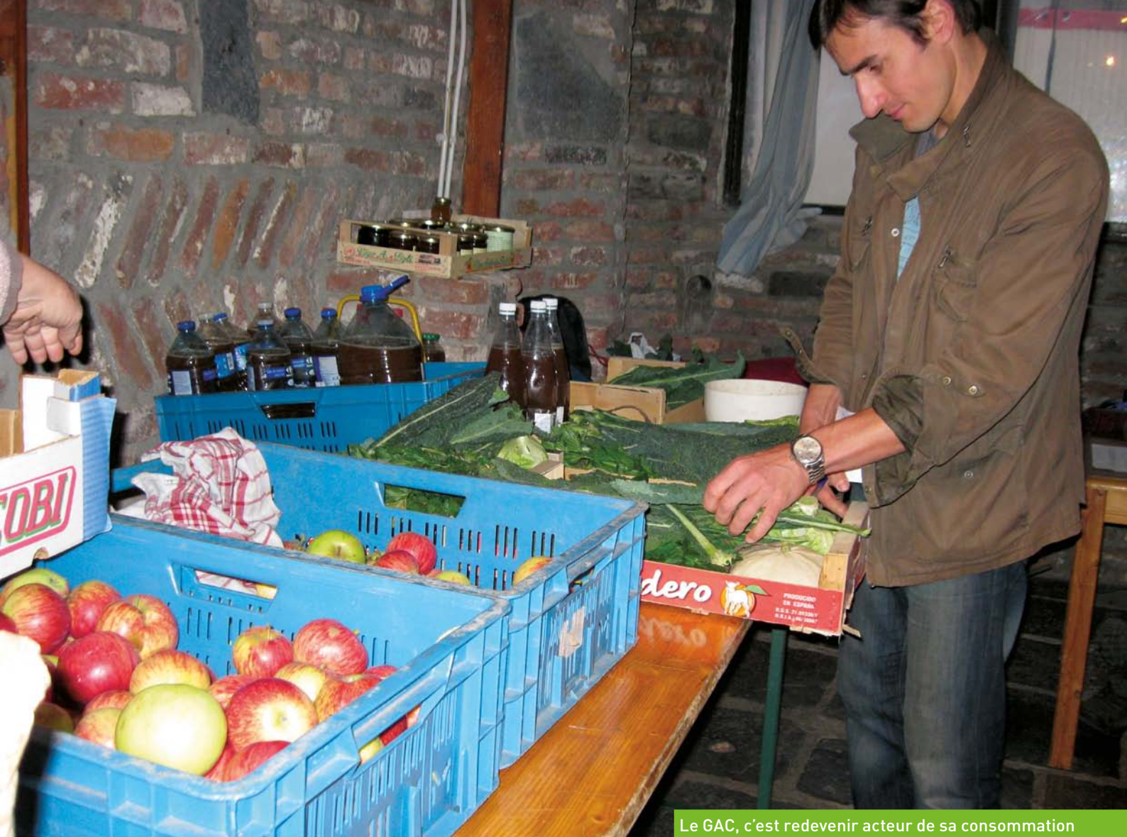
Le GAC, c'est redevenir acteur de sa consommation

nature, tout peut être détruit avec une forte pluie, des gelées ou bien une maladie dans les plantations.