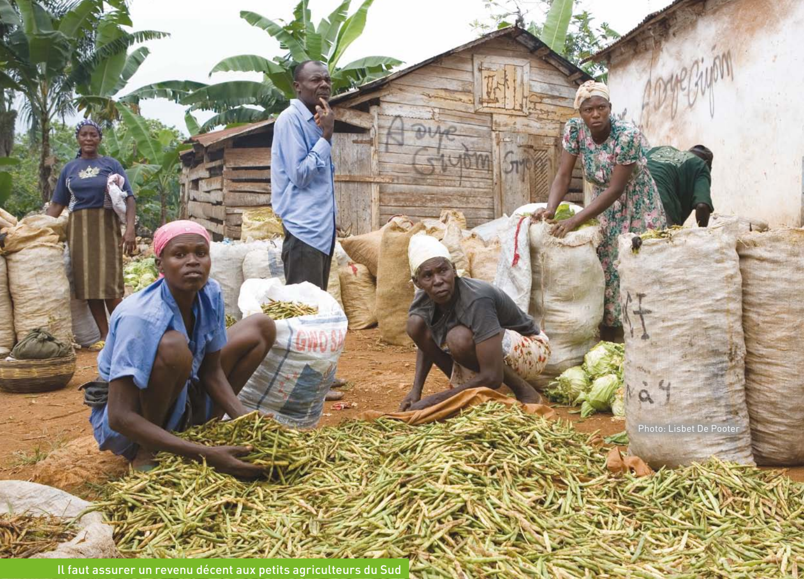
Il faut assurer un revenu décent aux petits agriculteurs du Sud

Depuis 1995, année où les accords de Marrakech ont été ratifiés par les pays membres de l'OMC 4 , l'agriculture n'est plus considérée comme un moyen de nourrir la planète mais comme un secteur économique qui engendre des bénéfices et permet la spéculation !