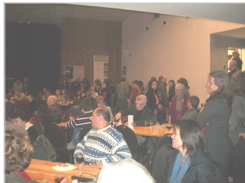
Rencontre avec Harmhel à la Maison du peuple

La salle Germinal de Braine-l'Alleud, aussi appelée la Maison du peuple, a rarement porté aussi bien son nom qu'en cette soirée du 17 mars. Le célèbre roman d'Emile Zola dénonçait sans ménagement la condition d'exploitation des ouvriers dans les mines et leur révolte. C'est bien de dénonciation et de révolte qu'il s'est agi, parlant toutefois d'une réalité différente, celle de l'agrobusiness et en particulier des agrocarburants.