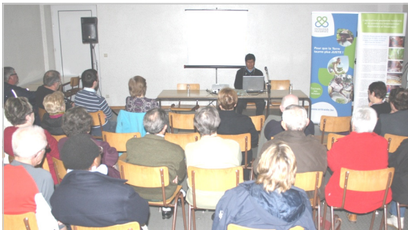
Soirée « bol de riz »/conférence à Habay

Comme chaque année, les groupes de La Roche et Baillonville ont également accueilli chaleureusement notre partenaire, et les groupes de Paliseul et du pôle solidarité de Barvaux se sont une fois de plus mis aux fourneaux pour soutenir les petits agriculteurs du Guatemala. MERCI à tous !!