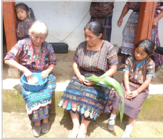
Tenues traditionnelles pour ces 3 générations de femmes

R. Oui mais aussi les filles-mères qui restent chez les parents pour que leurs enfants soient gardés pendant qu'elles travaillent à l'extérieur.