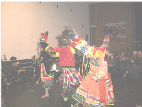
Danses traditionnelles nicaraguayennes exécutées par le groupe Tetinkatinku

Enfin, une fois de plus, la convivialité était au rendez-vous et a permis à chacun de sortir de cette soirée plein d'enthousiasme et conscient d'enjeux qui nous concernent tous.