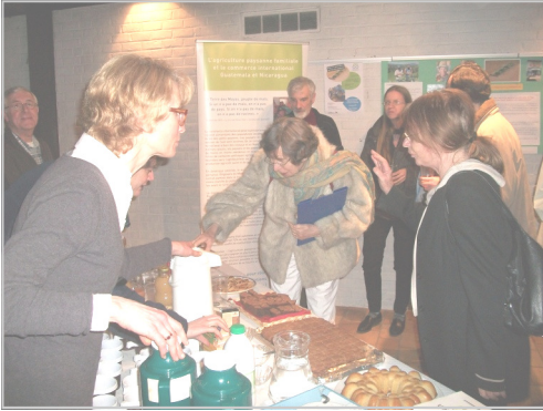
La pause-café à l'église St-Paul de Waterloo le 16 mars

Après des semaines de préparation en guise d'apéritif et quelques animations en hors-d'œuvre, vient enfin le plat de résistance : la campagne de Carême (de partage) ! Cette métaphore culinaire n'a d'autre but que de mettre en avant les multiples aspects couverts par les traditionnelles soirées de sensibilisation d'Entraide & Fraternité au cours de ses campagnes et le rôle essentiel joué par les volontaires, que ce soit au niveau de la préparation, de la diffusion d'information, de la logistique et de l'animation en tant que telle.