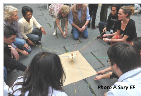
...les parents s'adonnent à d'autres jeux...