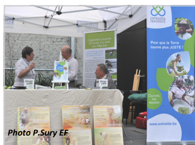
Permanents et volontaires se sont relayés tout au long de la journée pour tenir le stand d'information .