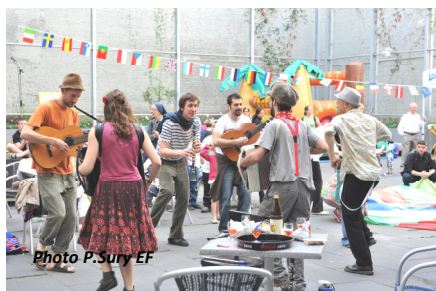
Ci-contre à gauche : Accueil chaleureux dans la cour intérieure avec de la musique folk... Un vent de printemps souffle sur la fête qui ne fait que commencer