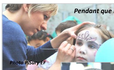
Pendant que les enfants se griment...