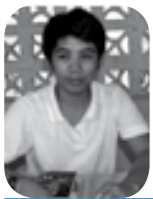
1 Responsable de l'information à Sumpay Mindanao, membre du Secrétariat de Kilusang Maralita sa Kanayunan (KILOS KA)

Les organisations de paysans ont toujours compté parmi les principales forces au sein des mouvements indépendantistes philippins, tant lors de la colonisation espagnole que lors des occupations américaine et japonaise ou encore de nos jours. Les paysannes ont joué un grand rôle au sein de ces mouvements, que ce soit dans les luttes pour la Réforme Agraire ou celles en faveur des moyens de production pour les paysans.