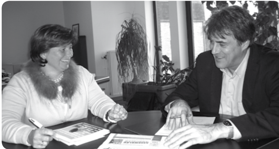
Par Marianne Streel, Présidente de l'Union des Agricultrices Wallonnes (UAW)