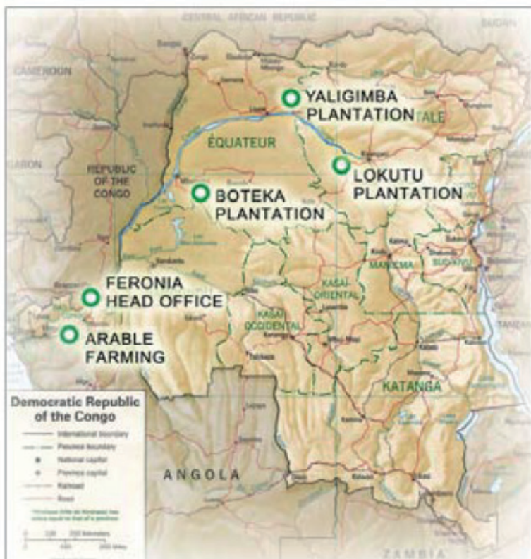
FIGURE 2 CARTE DE LA RDC INDIQUANT LES PLANTATIONS DE FERONIA (RAPPORT GRAIN 2015)

Leur situation ne s'améliore pas pour autant. Les manquements de Feronia aux droits des travailleurs sont aussi nombreux que ses manquements au droit foncier congolais.