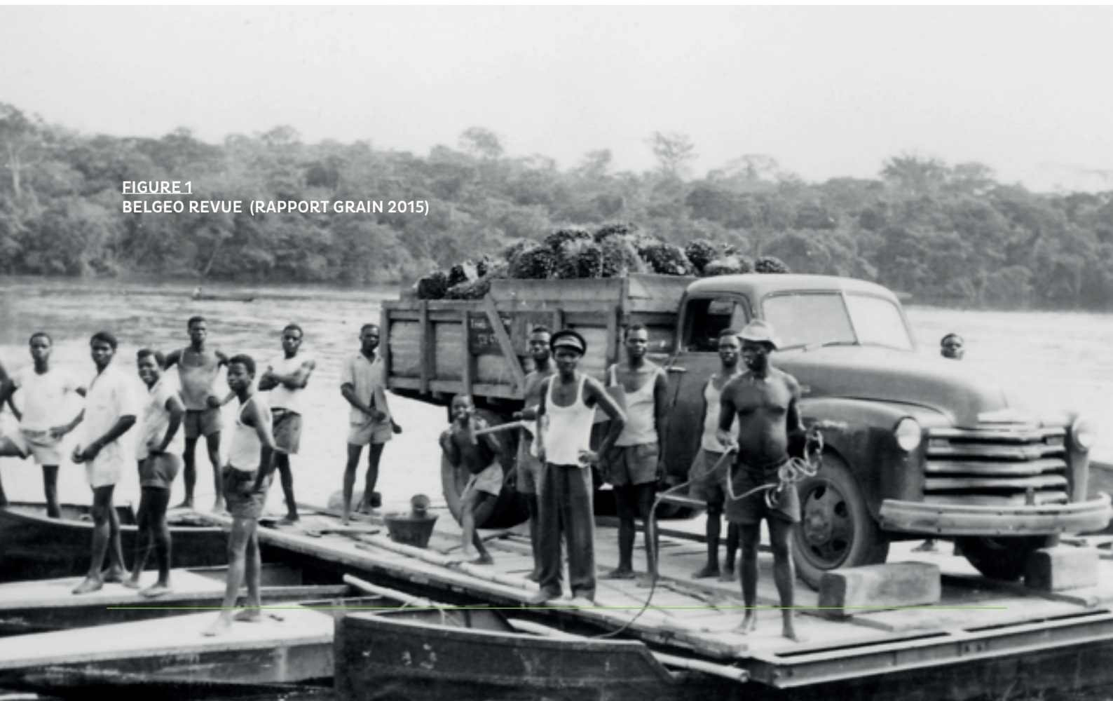
FIGURE 1 BELGEO REVUE (RAPPORT GRAIN 2015)

La colonie belge n'existe plus depuis 1960 mais les plantations accordées à William Lever, elles, subsistent, occupant plus de 100 000 hectares de terres qui sont pourtant nécessaires à la subsistance des populations locales. Ces plantations d'Unilever, sous exploitées et sous entretenues depuis des années, furent vendues en 2009 à l'entreprise Canadienne Feronia Inc. Cette vente ranime donc un conflit foncier vieux de 100 ans.