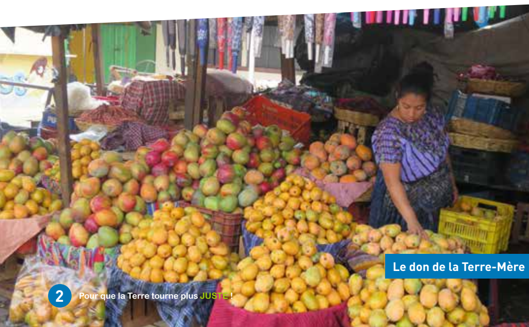
Le don de la Terre-Mère