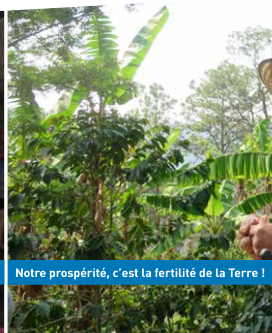
Notre prospérité, c'est la fertilité de la Terre !