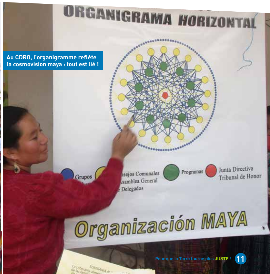
Au CDRO, l'organigramme reflète la cosmovision maya : tout est lié !