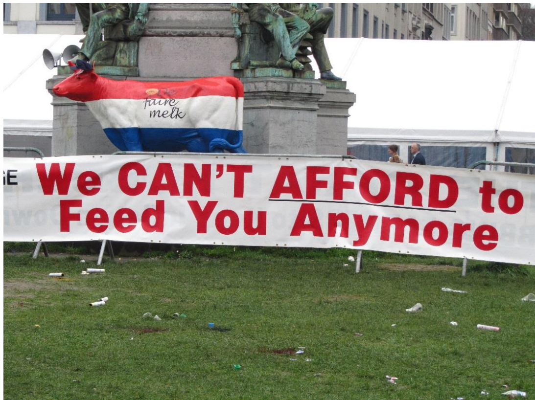
Message de producteurs laitiers lors d'une manifestation à Bruxelles en 2012