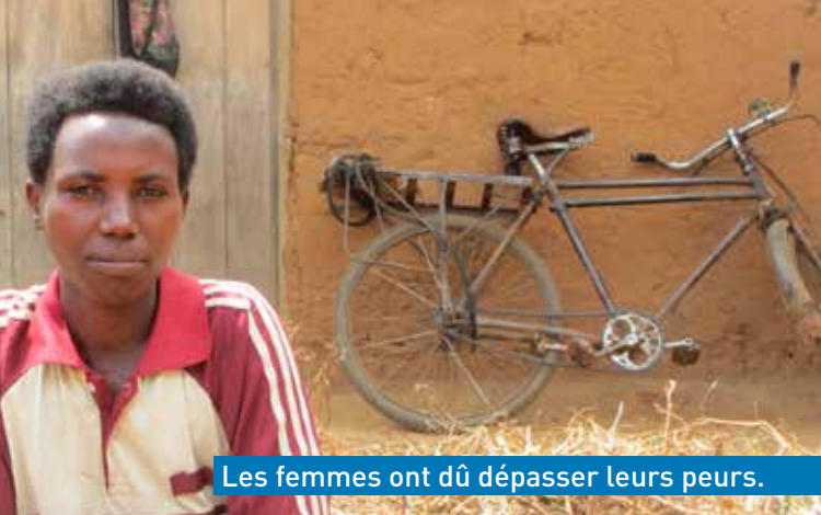
Les femmes ont dû dépasser leurs peurs.