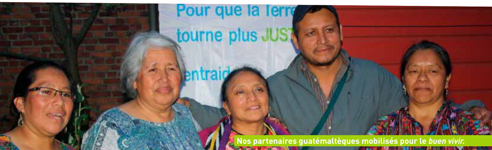
Nos partenaires guatémaltèques mobilisés pour le buen vivir .

■ Propos recueillis par Jean-François Lauwens chargé de communication