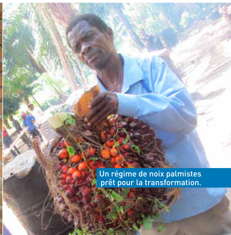
Un régime de noix palmistes prêt pour la transformation.