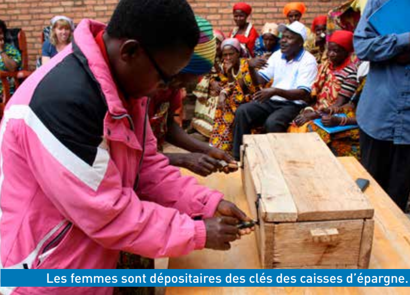
Les femmes sont dépositaires des clés des caisses d'épargne.