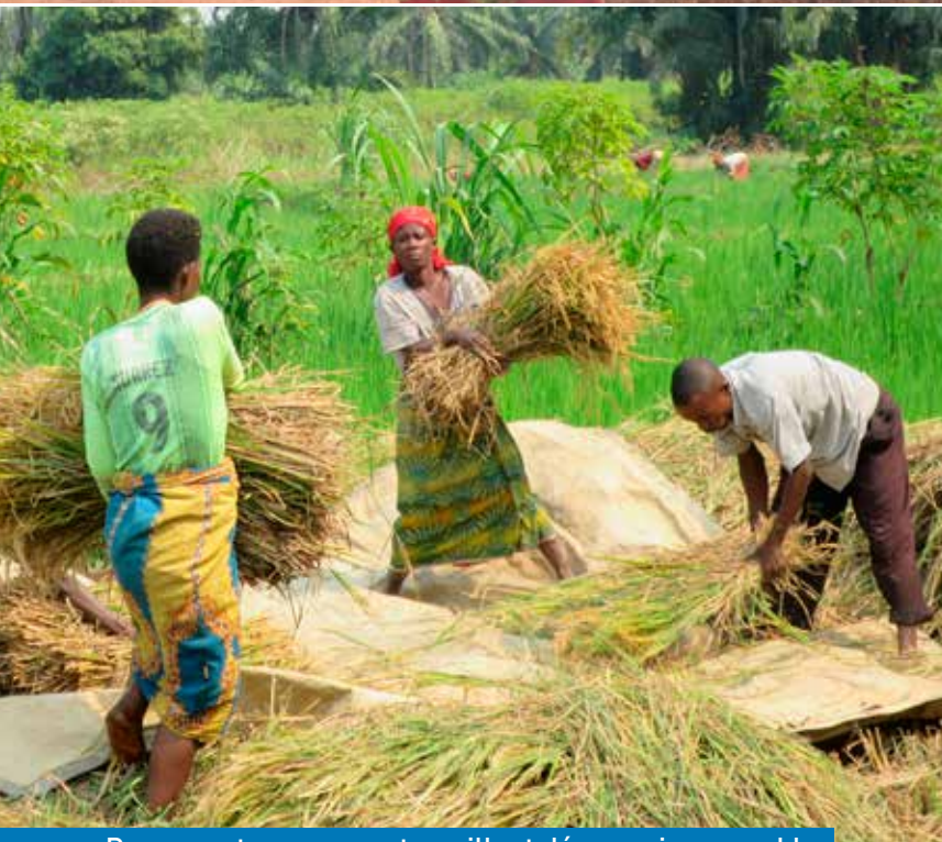
Paysans et paysannes travaillent désormais ensemble.

L'agroécologie, ce n'est donc pas seulement une question de nouvelles techniques agricoles, c'est aussi un nouveau modèle de société basé sur la coopération, la dignité et l'égalité des droits entre les hommes et les femmes. Un modèle qui, comme le prouve l'exemple du Burundi et de la RD Congo, bouleverse certaines traditions injustes pour le plus grand bénéfice de l'ensemble de la population.