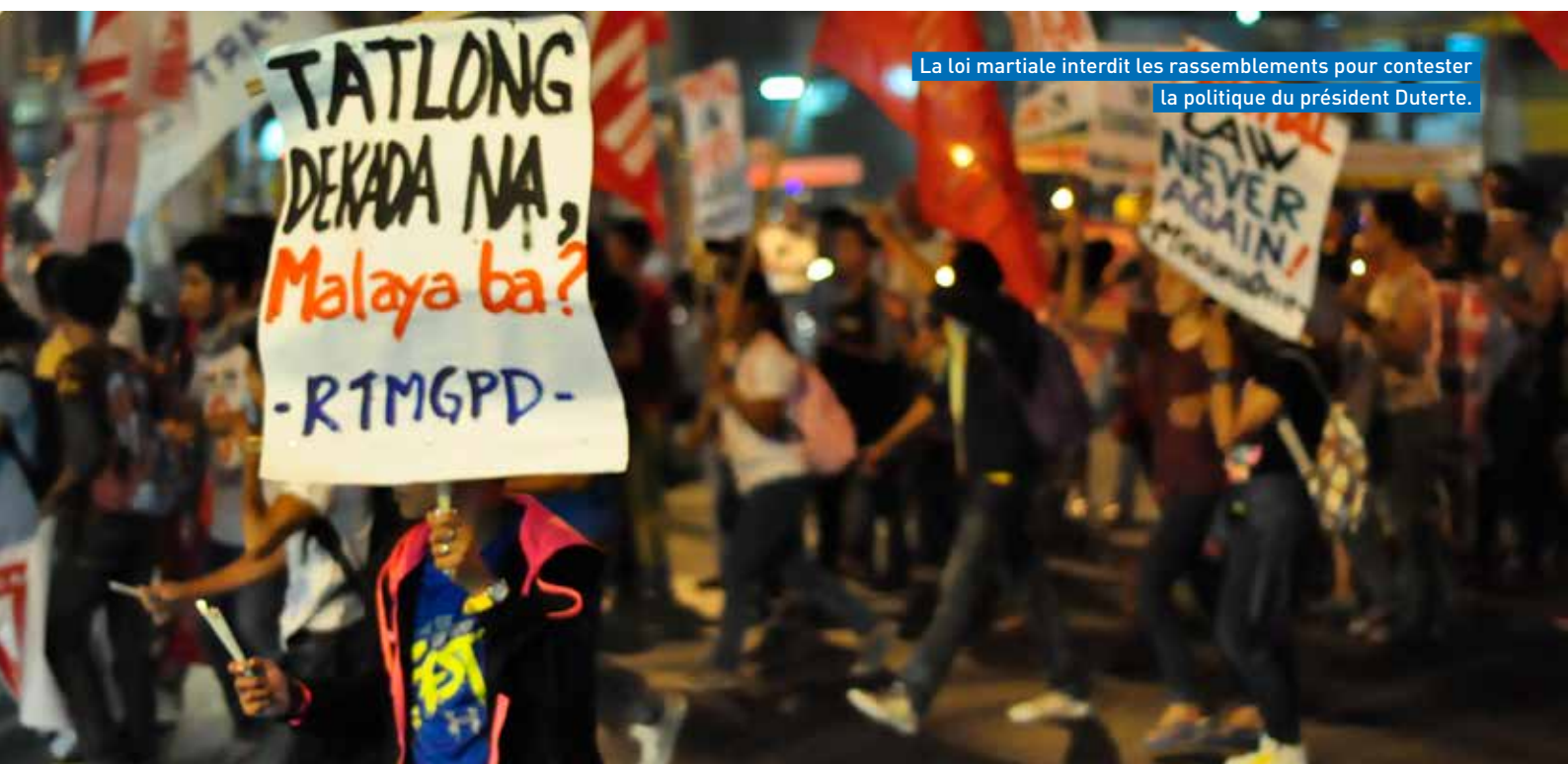
La loi martiale interdit les rassemblements pour contester la politique du président Duterte.