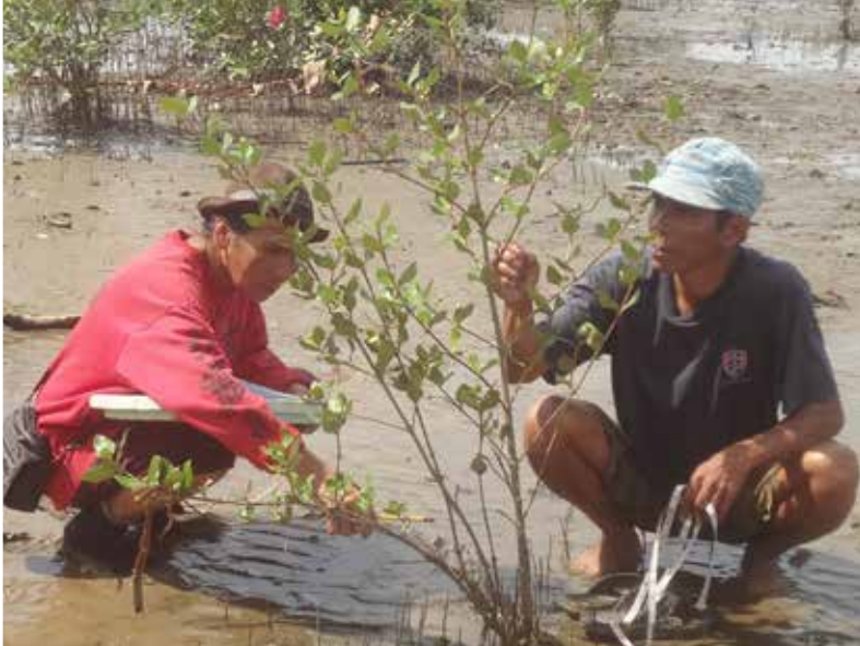
Plantation de mangroves, vente de sardines : LAFCCOD ne manque pas d'idées pour les pêcheurs de Mindanao.