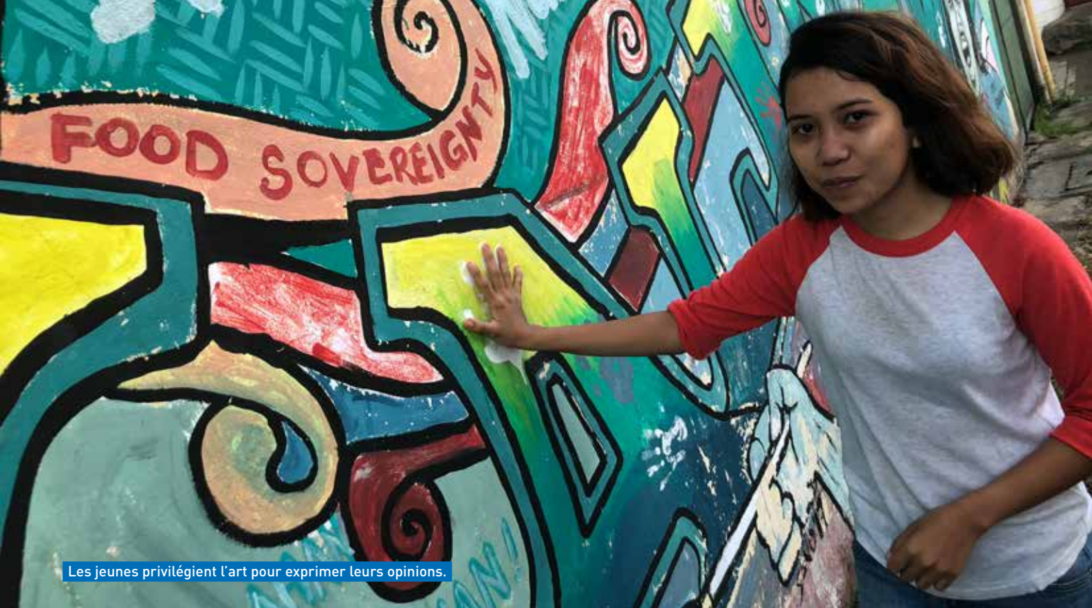
Les jeunes privilégient l'art pour exprimer leurs opinions.