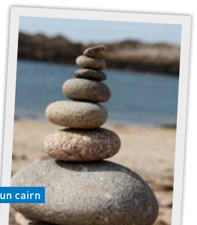
Exemple d'un cairn