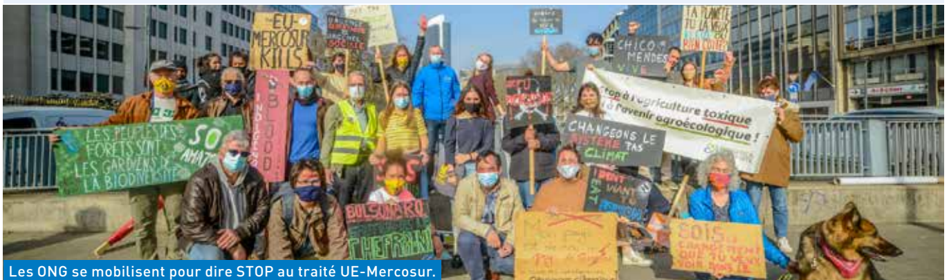
Les ONG se mobilisent pour dire STOP au traité UE-Mercosur.

Ce jour-là, une mobilisation publique aura lieu devant les institutions européennes pour dire STOP au traité UE-Mercosur!