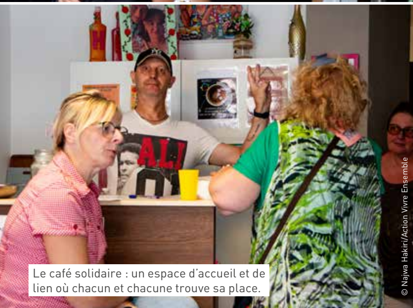
Le café solidaire : un espace d'accueil et de lien où chacun et chacune trouve sa place.