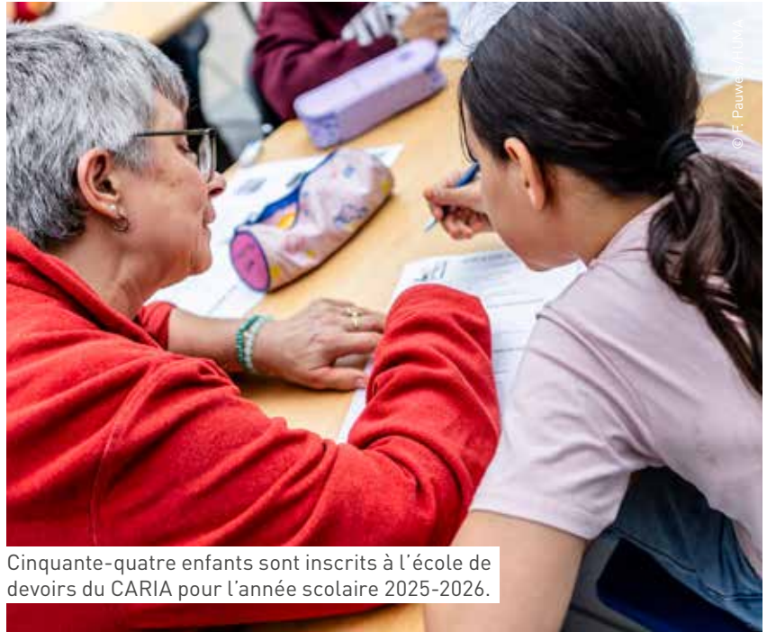
Cinquante-quatre enfants sont inscrits à l'école de devoirs du CARIA pour l'année scolaire 2025-2026.