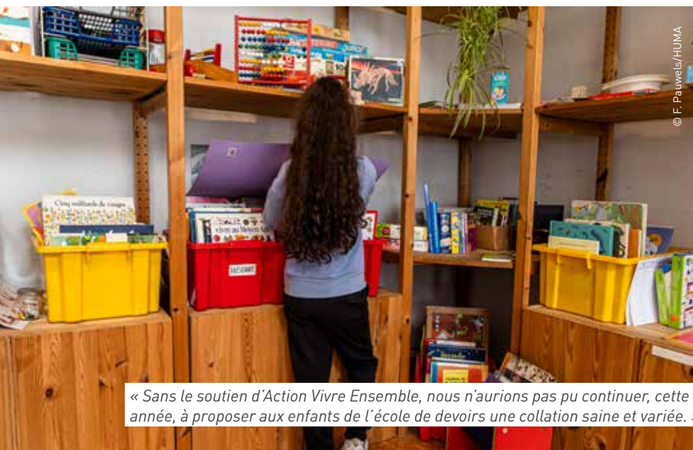
« Sans le soutien d'Action Vivre Ensemble, nous n'aurions pas pu continuer, cette année, à proposer aux enfants de l'école de devoirs une collation saine et variée. »