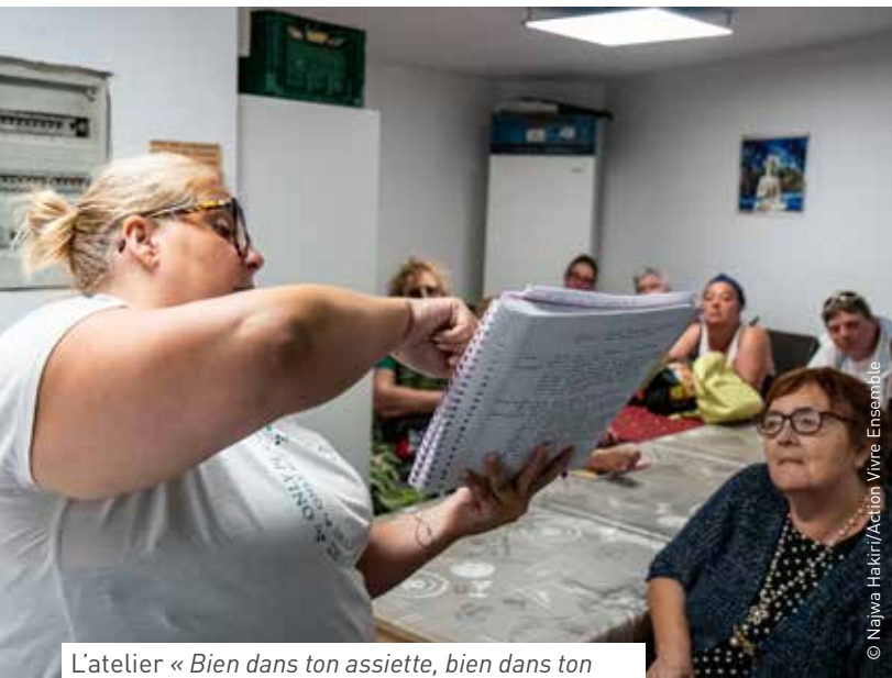
L'atelier « Bien dans ton assiette, bien dans ton corps et ton esprit » est animé par des bénévoles.