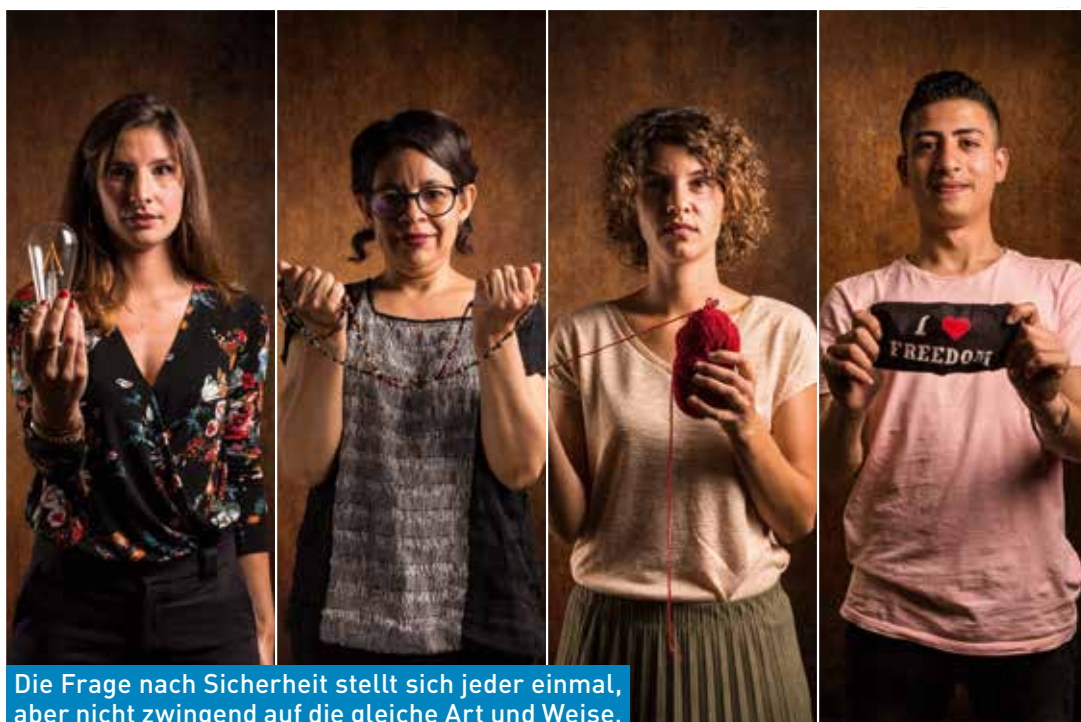
Die Frage nach Sicherheit stellt sich jeder einmal, aber nicht zwingend auf die gleiche Art und Weise.

Mit dem Kompass als Symbol wollten wir dafür Sorge tragen, eine systemische Vision zu bekommen, zu zeigen, dass alles miteinander verbunden ist. Wir stellen uns eine kreisförmige Verbindung vor, dieses verdeutlicht der Kompass besonders gut. Unser Kompass hat die Besonderheit, dass er keine Nadel besitzt, damit die Menschen wählen können, in welche Richtung sie gehen wollen. Zusätzlich zu dem Kompass in unserer Studie haben wir ein Animationstool entwickelt: „Der Kompass der Sicherheit in allen Facetten“. Dieses Tool ist dazu gedacht, die Menschen